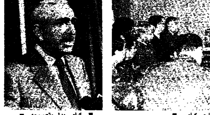
كراي يدي بتصريحه

واختار كافة الإجراءات التي تحول دون تعطيل دوره.